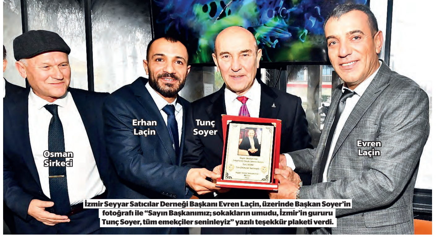
İzmir Seyyar Satıcılar Derneği Başkanı Evren Laçın, üzerinde Başkan Soyer'in fotoğrafı ile "Sayın Başkanımız; sokakların umudu, İzmir'in gururu Tunç Soyer, tüm emekçiler seninle" yazılı teşekkür plaketi verdi.

Son yok oluşun son salakları olarak tarihe geçtik!