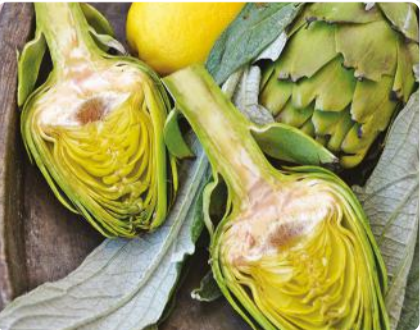
URLA SAKIZ ENGİNARI