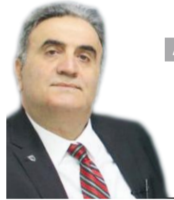
Ayhan Bülent Toptaş