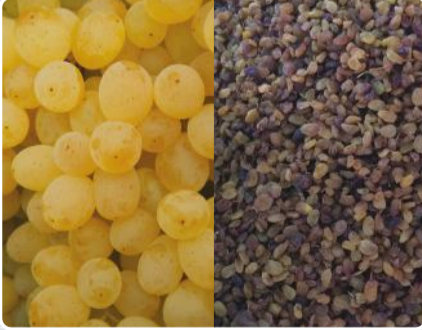
EGE SULTANI ÜZÜMÜ